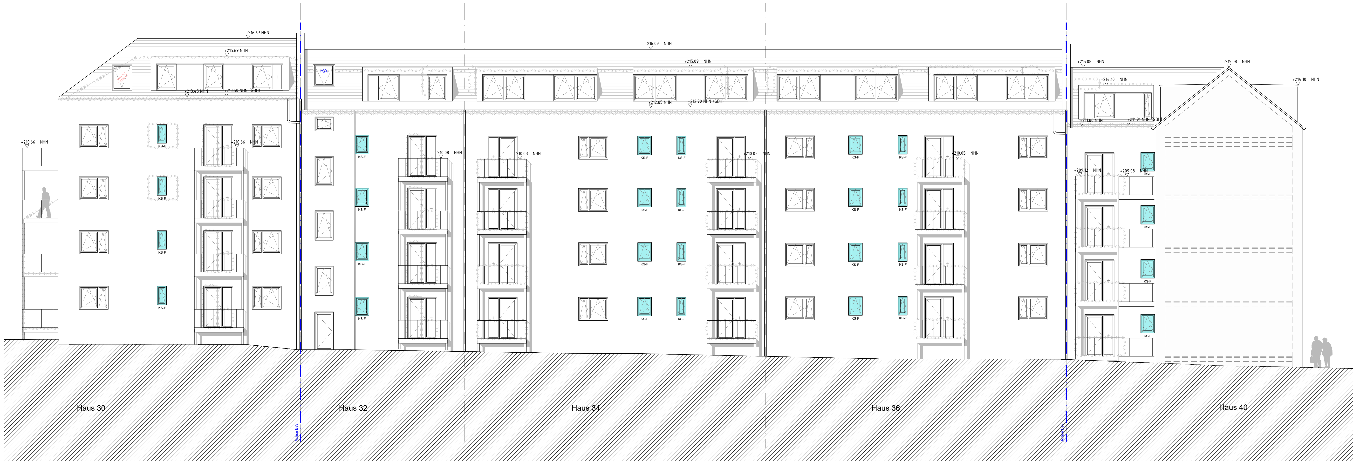
Ansicht Rückseite, Süd-West