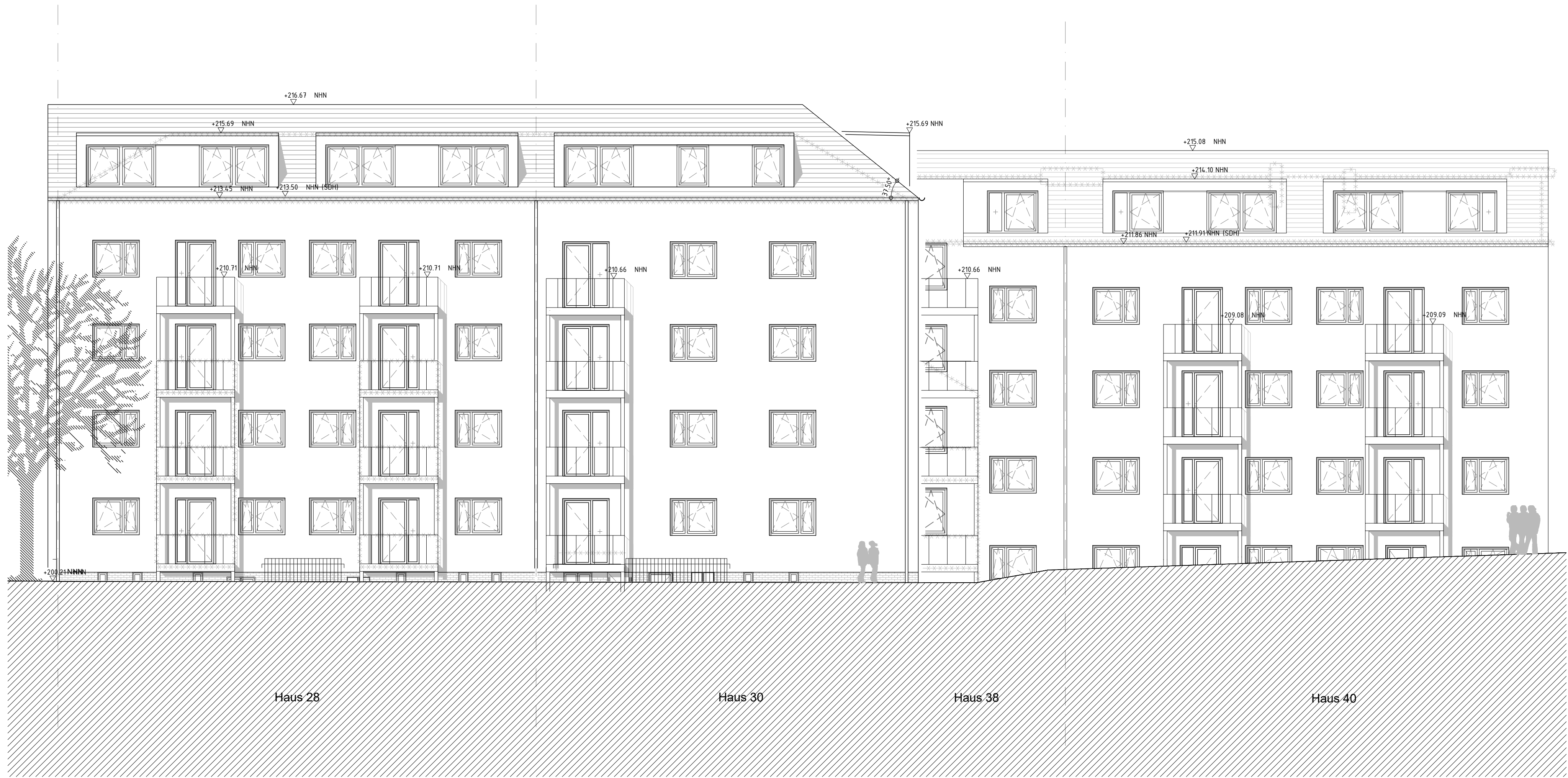
Ansicht Rückseit, Süd-Ost