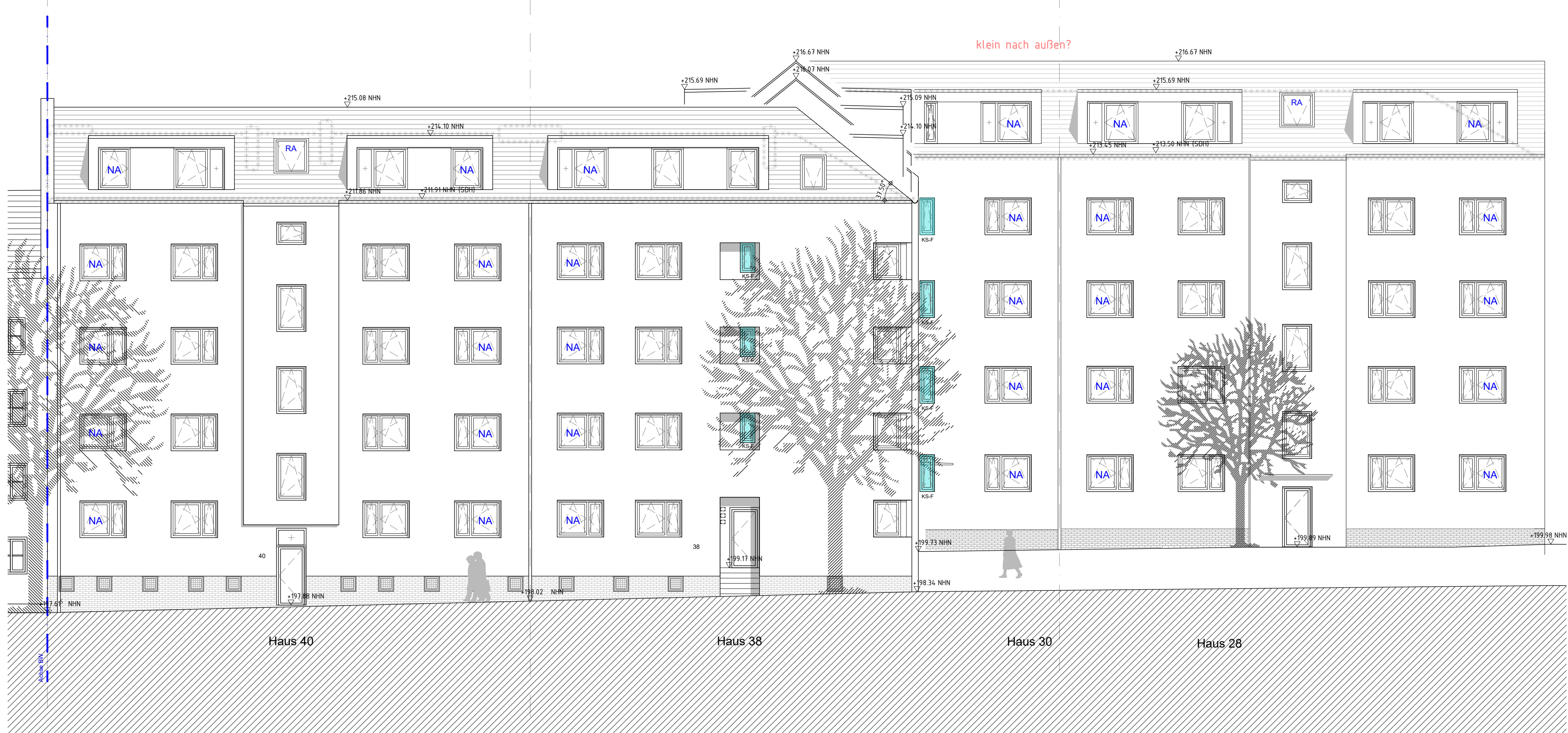
Ansicht Zeppelinstraße, Nord-West