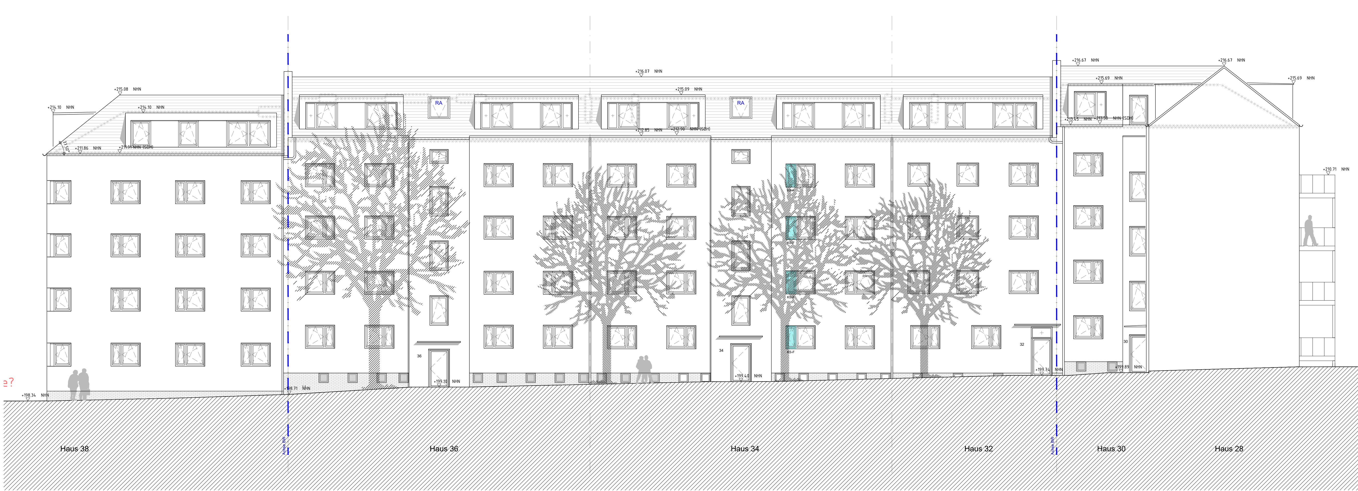
Ansicht Vorderseite-Innenhof, Nord-Ost